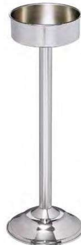
6029/3 inox 29/3 alluminio