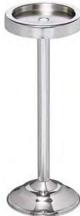
6029/2 inox 29/2 alluminio