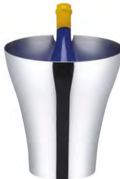
5900/1 - ASOLA