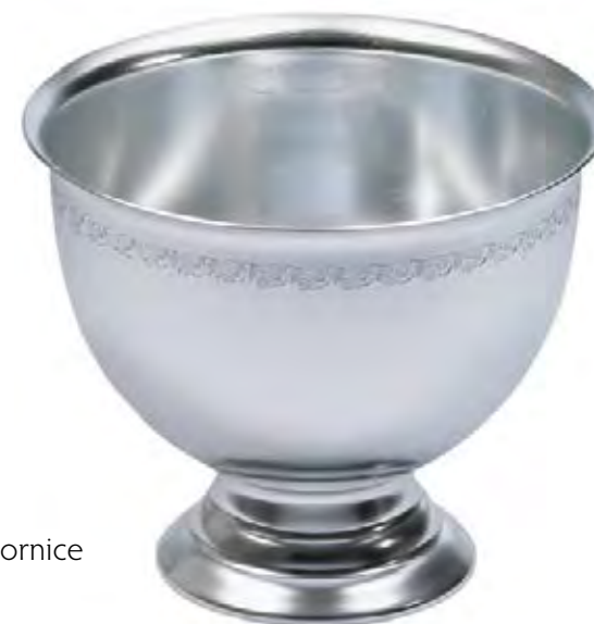
4901 con cornice

We produce buckets in double-walled aluminum with color variations.