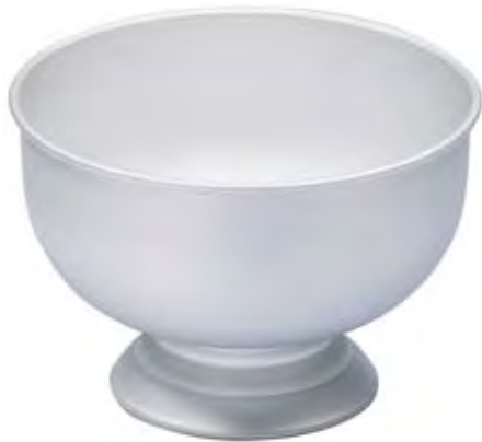
4903 Ø 30 cm