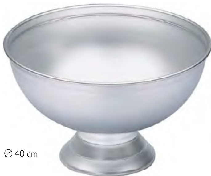
4905 Ø 40 cm