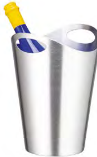
4500/1 - 2 FORI