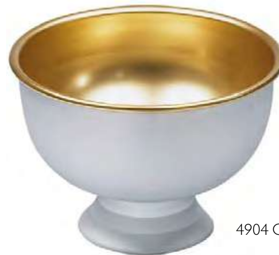
4904 COIB Ø 35 cm