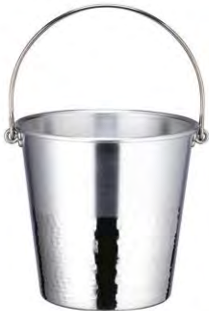
3070/1 CIONDOLO - MARTELLATO