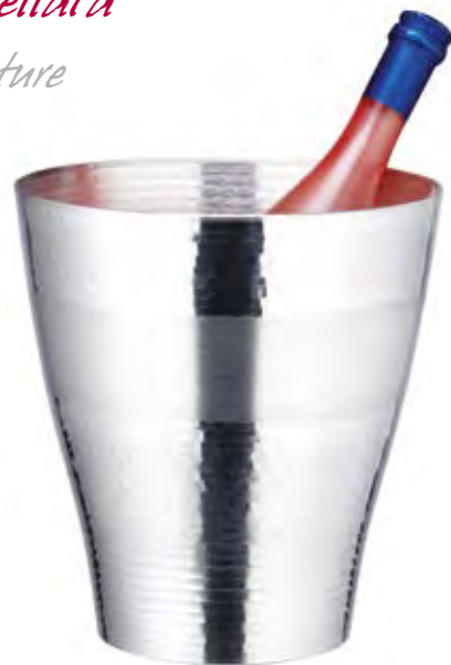
1172/1 - MARTELLATO