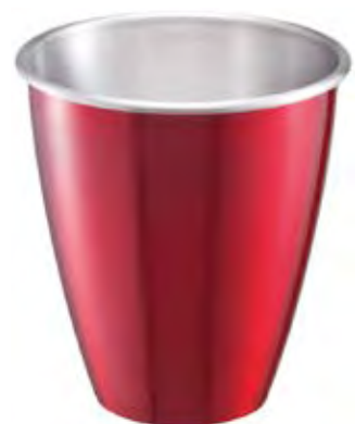
3073/1 VERNICIATO ESTERNO