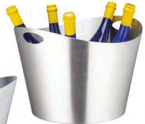
4500/4 - 2 FORI