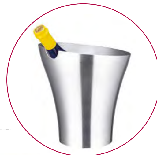
5900/1 INCL - ASOLA Su richiesta per quantità taglio inclinato